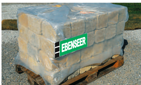
Antike Mauersteine werden auf Paletten geliefert.

Wenn Sie die Mauer mörteln und verfugen, verfüllt der Mörtel stark abgeschlagene Ecken und Kanten. Insgesamt verleihen diese Ecken und Kanten der Mauer ein sehr natürliches Aussehen.