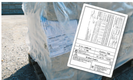
Auf jeder Palette finden Sie einen Beipackzettel zum jeweiligen Produkt. Dieser Zettel ist zum Schutz vor Wind etc. unter der Verpackungsfolie zu finden. Auf dem Beipackzettel finden Sie eine kurze Versetzanleitung und Informationen zum gelieferten Produkt